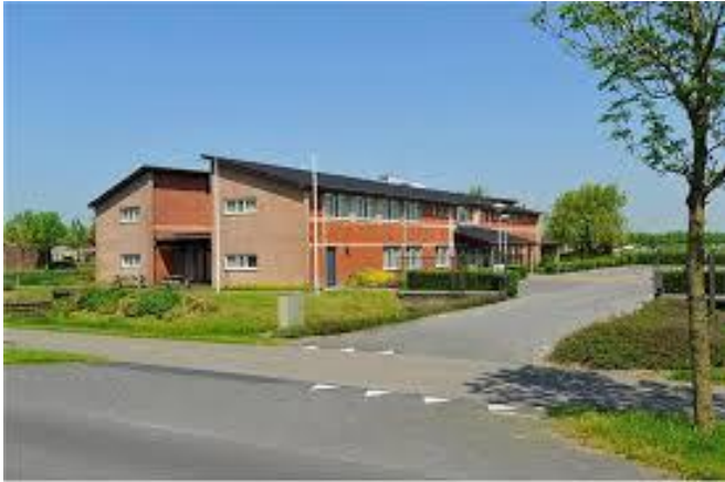
Het complete pand aan de Snekerweg 3

Hieronder een korte fotoimpressie van onze nieuwe locatie.